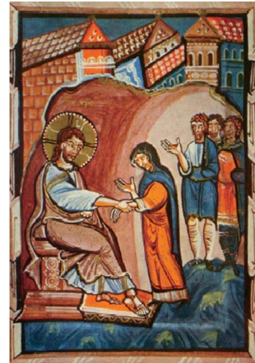
<시몬의 장모를 치유하는 예수님>