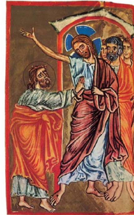
<예수님의 상처를 확인하는 토마스>