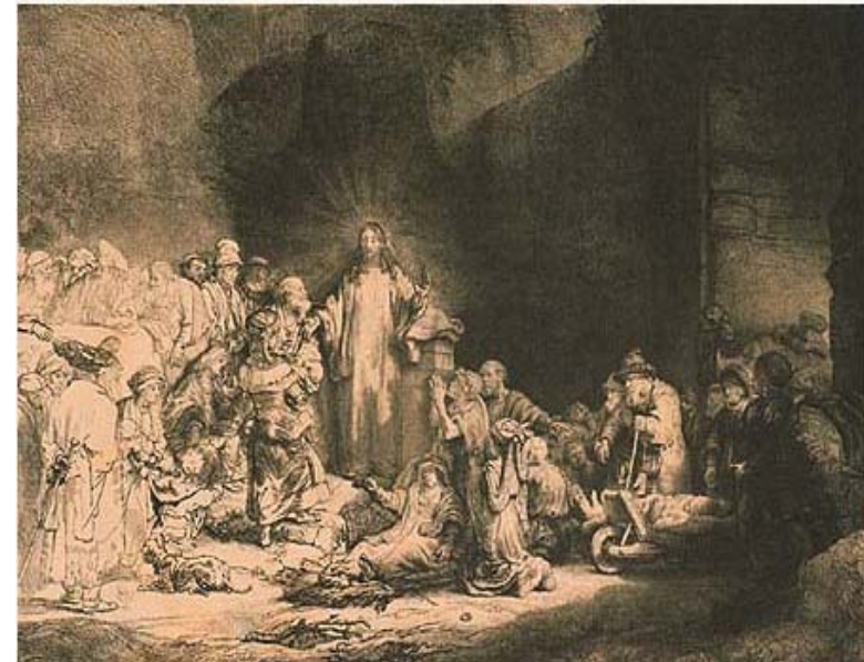
<병자들을 치유하는 그리스도>

렘브란트 (1609-1669), 동판화, 암스테르담 국립미술관, 네덜란드