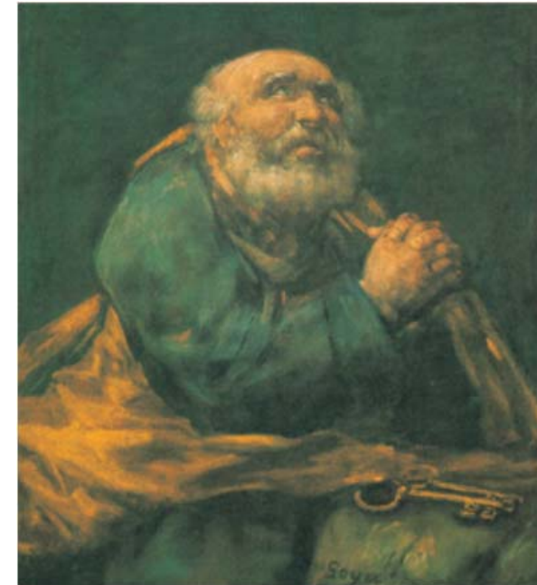
<베드로 사도의 회개>