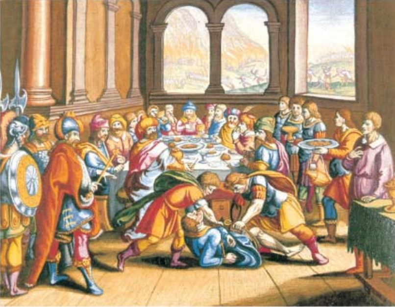
<임금의 아들 혼인잔치 비유> 마태우스 메리안 (1593-1650) 채색 동판화, 독일