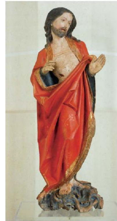
<승천하시는 그리스도>, 1500년 경, 채색목조각, 루브르 박물관, 파리, 프랑스