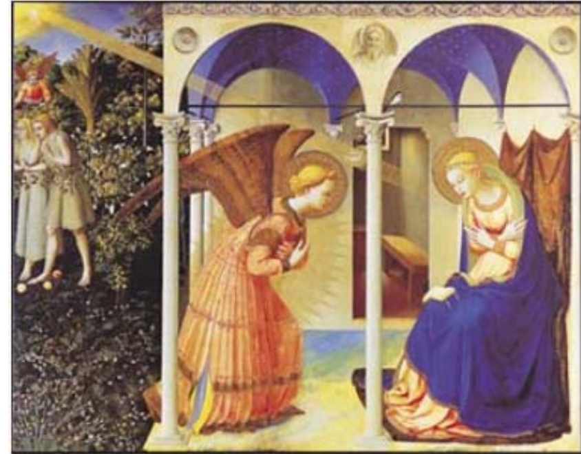
<주님 탄생 예고>

프라 안젤리코 (1399-1455), 템페라, 프라도 미술관, 마드리드, 스페인